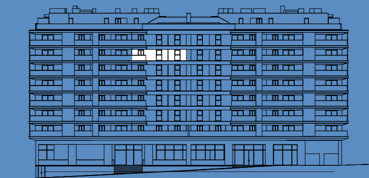
Planta Geral do Piso General Floorplan